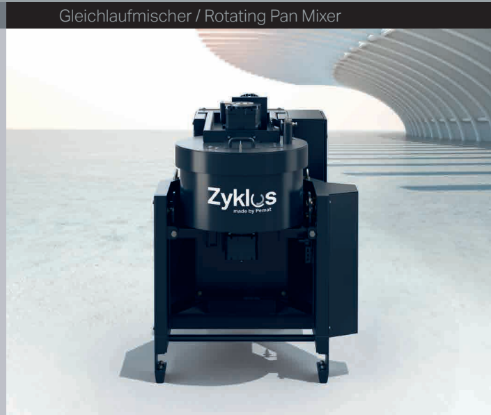
Gleichlaufmischer / Rotating Pan Mixer

Greatest homogeneity in the shortest time with rotating mix principle. Suitable for all methods of application - mobile and tilting options available.