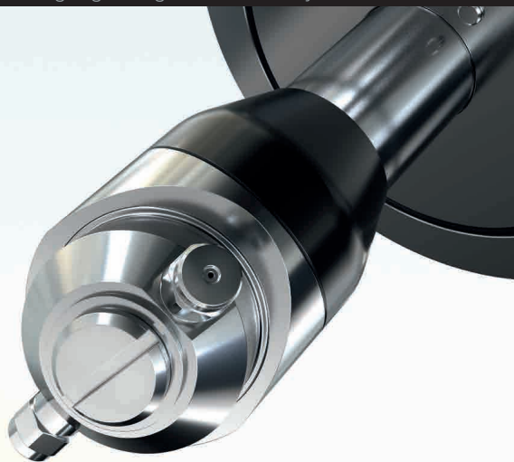
Reinigungsanlage / Wash-out system