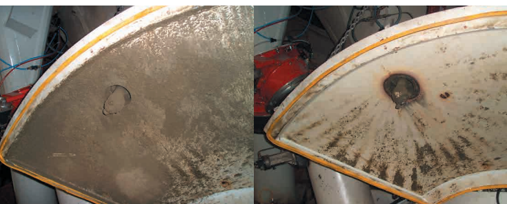
Vor und nach der Reinigung mit der PHR

Mit dem Einsatz einer automatischen Pemat Hochdruckreinigungsanlage lassen sich bis zu 50% der Wassermenge im Vergleich zur Handreinigung einsparen. Gerade in der Herstellung hochwertiger Betonprodukte, in der die Mischer mehrmals am Tag gereinigt werden müssen, lassen sich so die Kosten für Wasserversorgung signifikant reduzieren.