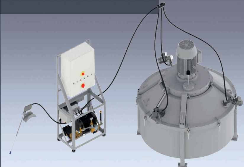
Pumpenaggregat mit Steuerung