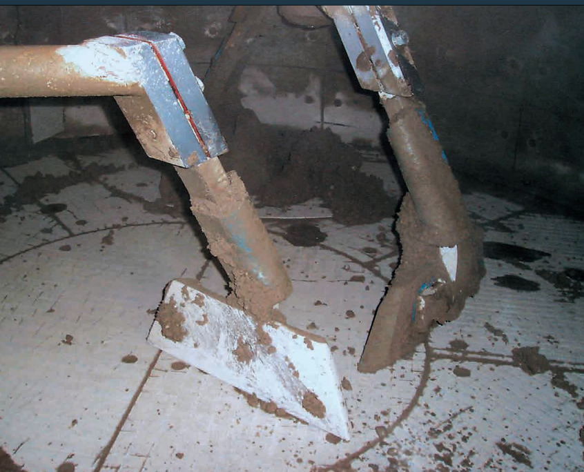
Vor der Reinigung