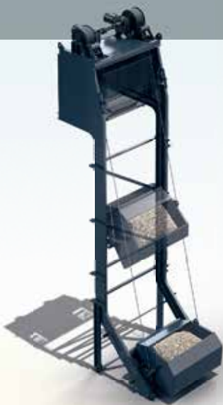
Der PAK in Aktion