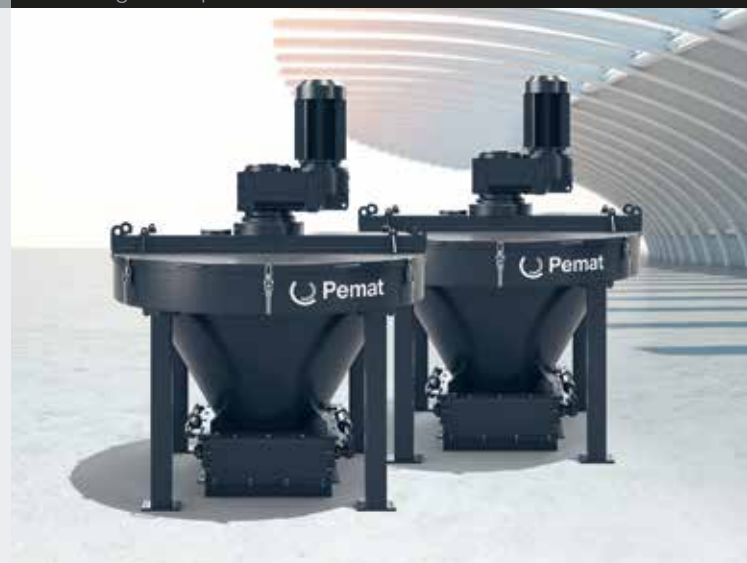
Kegelstumpfmischer / Conical Mixer

For dry ingredients and large-grained mixtures in a wide variety of demanding mixing technology tasks.