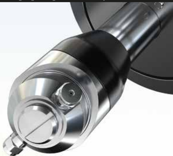
Reinigungsanlage / Wash-out system