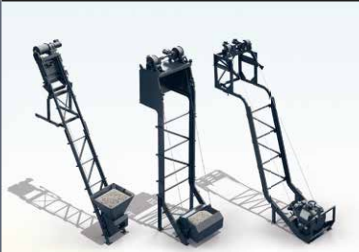
Beschickungsaufzüge / Skip Hoists