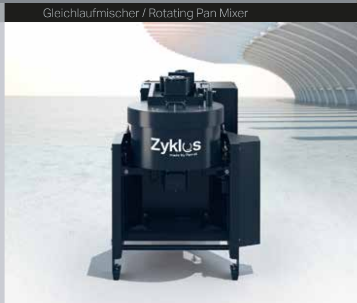
Gleichlaufmischer / Rotating Pan Mixer

Greatest homogeneity in the shortest time with rotating mix principle. Suitable for all methods of application – mobile and tilting options available.